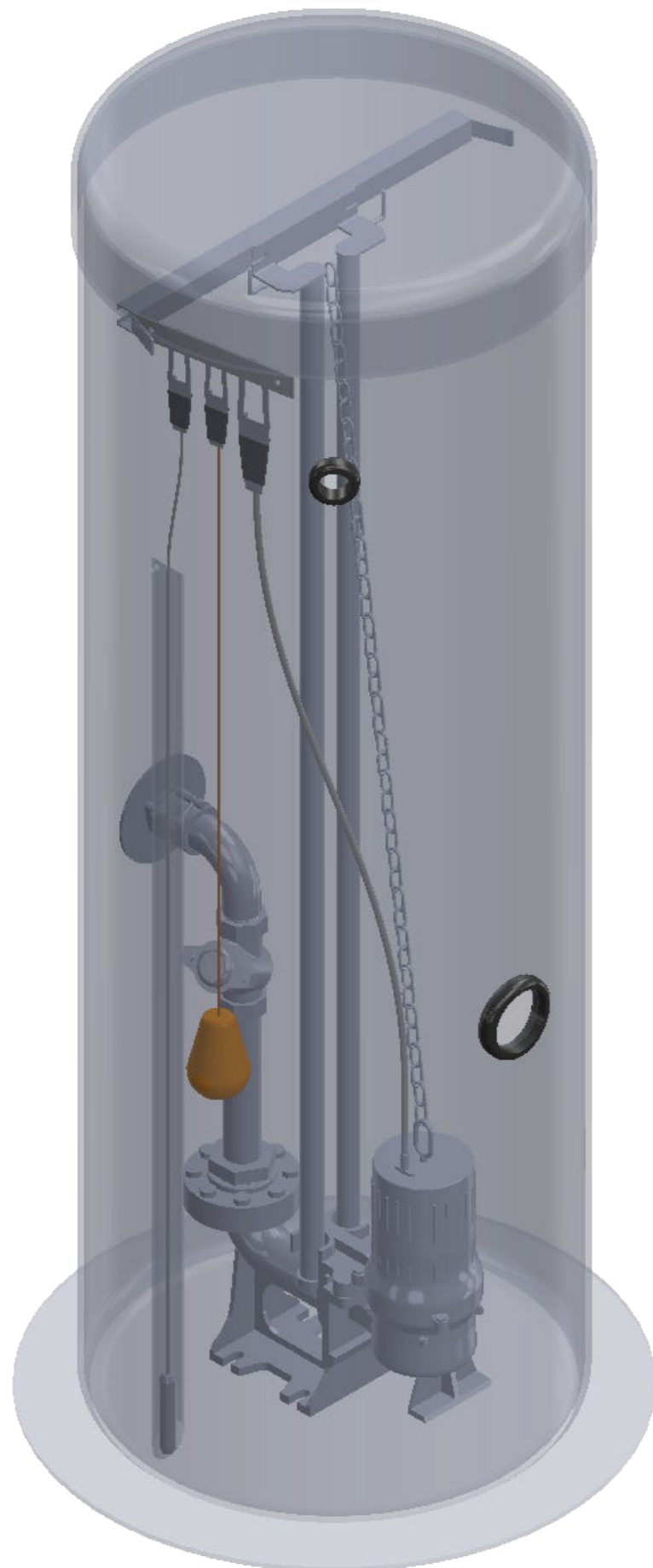
SCALE 1 : 10